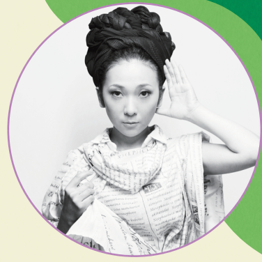
MISIA(アーティスト) mudef Ambassador として 「MISIAの森」プロジェクトを実施

https://www.pref.ishikawa.lg.jp/sizen/ontai/soundwave.html